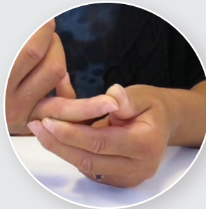
Extension des doigts un à un