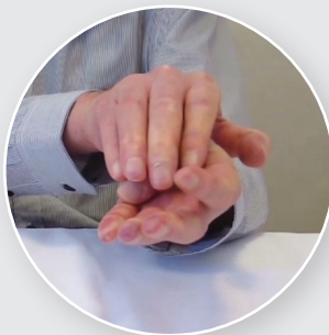
Flexion du pouce