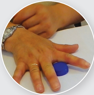
Écartement des doigts