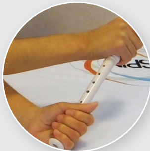
Rotation du poignet