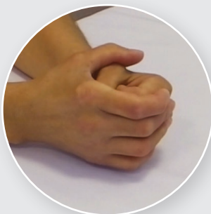
Flexion des articulations