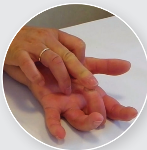
Flexion des doigts un à un